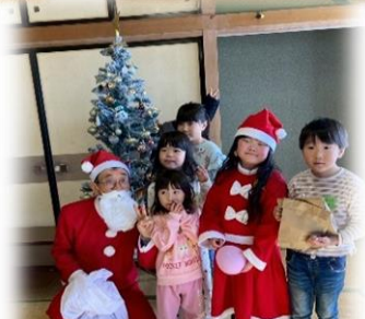
♡♡サンタさん、ありがとう♡♡ ツリーの後ろに隠れているのはだあれ?

今回のメニュー クリームシチュー 唐揚げ ほうれん草の白和え ロールパン プリンアラモード みかん 麦茶