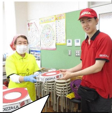
PIZZA-LAさんからも応援していただいています。