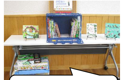
たくさんの本やゲームがあります。