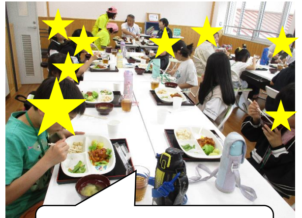
みんな美味しかったです。ごちそうさまでした。