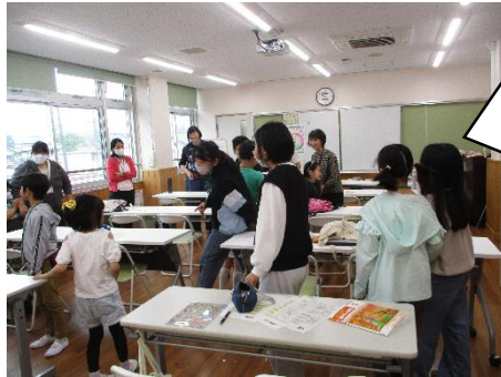
みんなで自己紹介をしています。