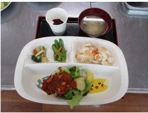
彩りのきれいな食事です。その中には地域からいただいた食材も多数あります。ありがとうございました。