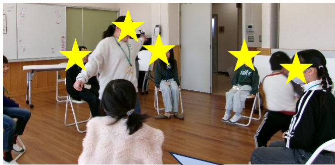
まず、最初のゲームは椅子取りゲーム ひやひやドキドキ