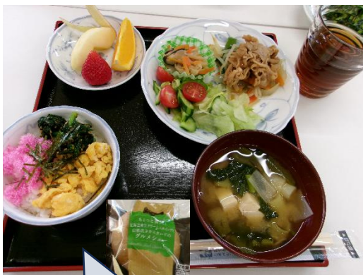
春の訪れを感じさせる優しい色合いのお料理ですね。

いつも美味しいランチを作っていたらいるクックスタッフさんに感謝の気持ちを込めた色紙をおわたしました。