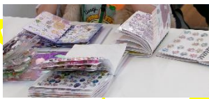
ボンボンドロップシール