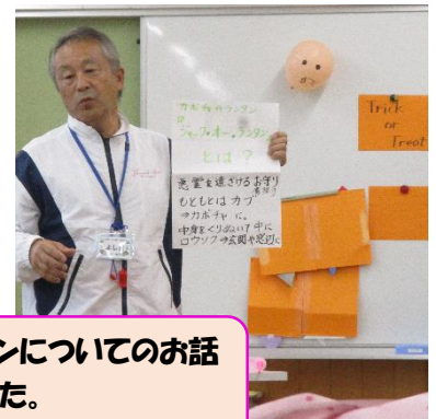
スタッフの先生方からハロウィンについてのお話やクイズを出していただきました。