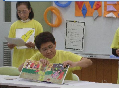
更生保護女性会のみなさんから、素敵な読み聞かせやプレゼントをいただきました。