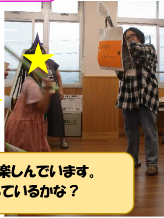
ピナーターを楽しんでいます。中には何が入っているかな?