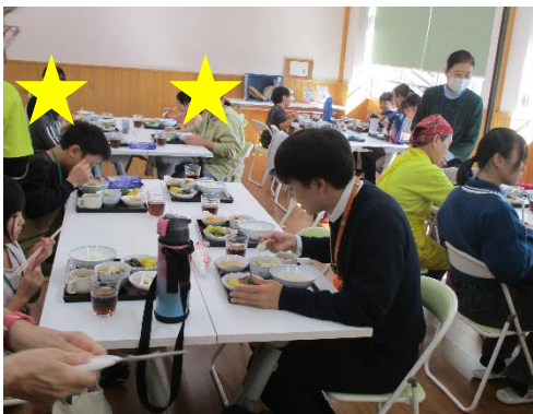
講師の先生と一緒に食事 をいただきました。