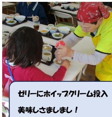
ゼリーにホイップクリーム投入 美味しさましまし!