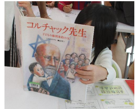
子どもの権利条約の父 コルチャック先生の本を 読んでいます。