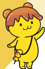
秩父市 ポテくまくん

埼玉県で自然が豊かな「寄居町」 「秩父市」「小川町」は、特急利用 で池袋駅まで約60分～90分。都心 へのアクセスも良く、引っ越し感 覚で移住することも可能です。