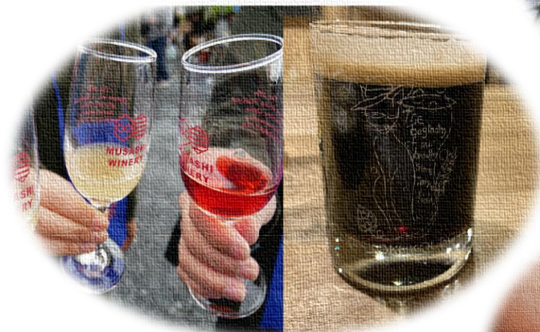
小川町で生産される「ワインや地ビール」