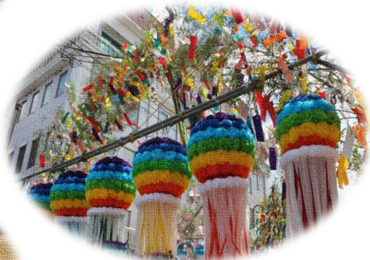
小川町七夕まつりで「和紙」を使用した竹飾り