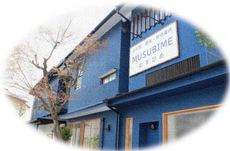
外と内をつなぐ魅力発信拠点「むすびめ」