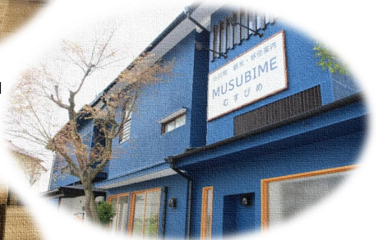
外と内をつなぐ魅力発信拠点「むすびめ」