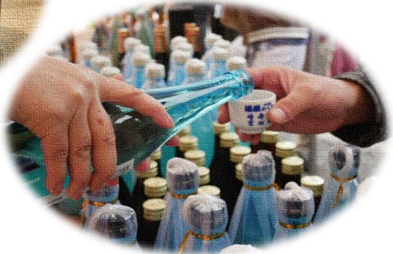
小川町の酒蔵をめぐる「酒蔵めぐり」