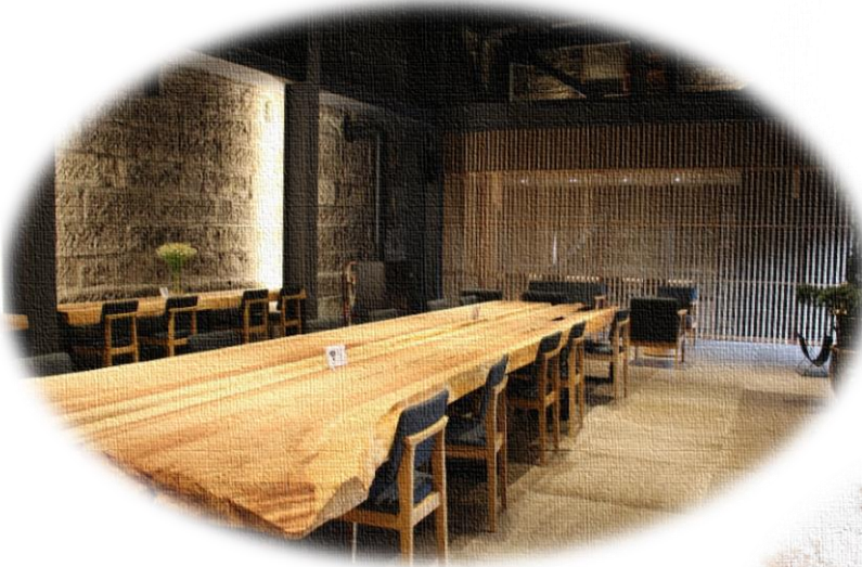
大谷石蔵を改修したサテライトオフィス「NESTo」