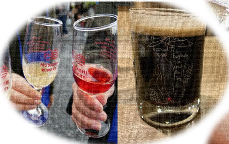
小川町で生産される「ワインや地ビール」