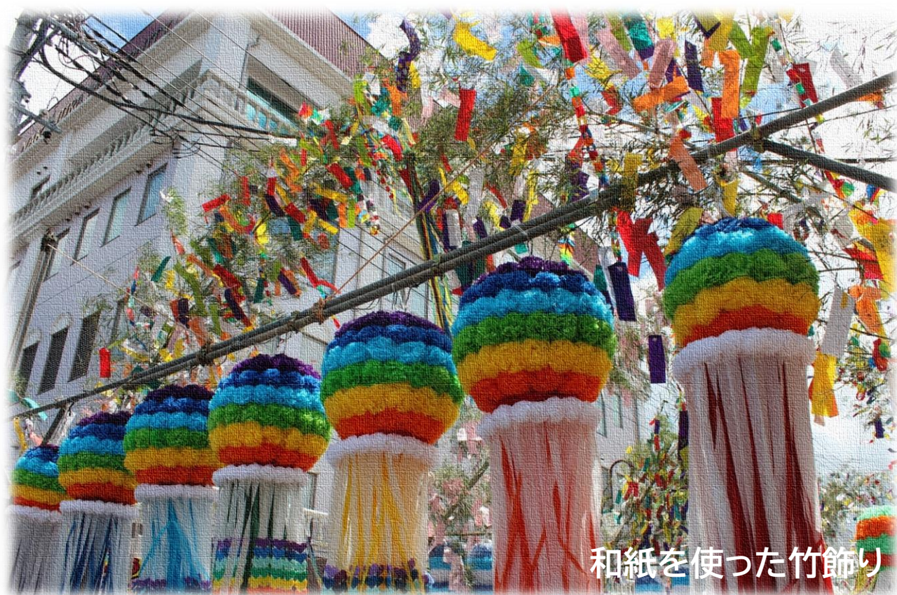
和紙を使った竹飾り