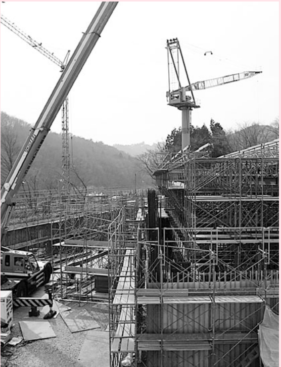
工事中の西中学校

問 7月15日までの工期を守ることはできるのか。 答 3業者・発注側としても、地域の信頼を損ねるわけにはいきませんので、何としても対応し、期日を守っていきます。 問 この建設は、国の補助金を活用して成立している。事故繰越の見込みはどうなのか。 答 県への書類提出と打ち合わせは既に済んでおり、3月の半ばに国との打ち合わせと書類提出をする段取りになっています。