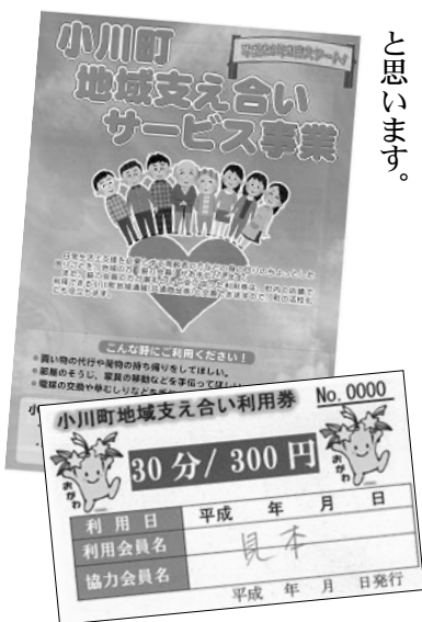
パンフレットと利用券

今、地域が抱える問題に人間関係の希薄さというものがあると思います。特に感じるのが、年に3、4回の共同作業にしか顔を合わせる機会がなく、世代間の交流も減っていることです。地域の持つ力を生かしていくためには、このような交流がなくてはならないと思います。年長者は、その経験と知識を伝承する意識を持つことが必要ではないでしょうか。一例ですが、我が能増地区では、30代から60代の20人ほどで親睦旅行をしています。これが、1年を通して地域行事への参加が活発になるきっかけづくりになっています。このように、1人でも多くの人と交流を持つことから、活力ある地域づくりが始まるのだと思います。小川町議会にも地域の活力の大切さを認識していただき、次世代へとつなぐ努力をしていただきたいと思います。