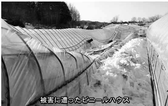
被害に遭ったビニールハウス

次世代自動車充電インフラ整備事業 問 25年度重点事業、そして国庫補助事業にもなっているが、なぜ890万5000円減になったのか。 答 役場と伝統工芸会館の2基設置で、2300万円の予算を組みましたが、入札の結果、1400万円程度で落札されましたので、補正減となっています。 風しん任意予防接種費用助成 問 助成金の171万円減