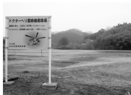
整備が待たれる野球場予定地

質問 総合運動場の今後の将来野球場として整備を計画している場所について、多目的グラウンドのサブグラウンドとして整備する考えは。また、整備する場合費用はどのくらいかかるのか。