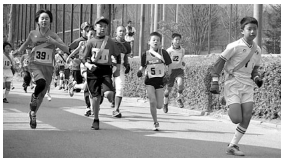
第30回入部少駅伝大会