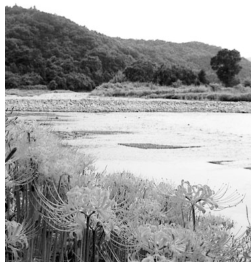
遊歩道が待たれる槻川（下里和具）

政策推進課長 当初の事業は、パトリアおがわから埼玉伝統工芸会館付近までとしていましたが、川の再生懇談会の委員からの意見もあり、当町から嵐山町までの槻川全体が区域となっています。