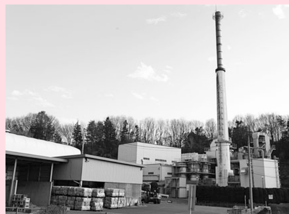
小川地区衛生組合ごみ焼却場

一般質問の中で、新施設移行までのおよそ7年間にかかる修繕・整備に約30億円必要とのことであり、財政的に厳しい状況が続くことが分かりました。