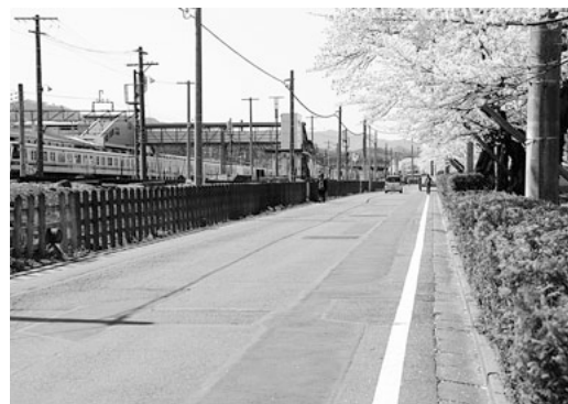
駅北側 小川高校前

質問 旧上野台中学校の活用 答弁 政策推進課長 訓練実施の際には、必ず小川消防署が安全管理に当たることなど、事故防止に万全を尽くしています。騒音調査等については、特に行なっていないません。