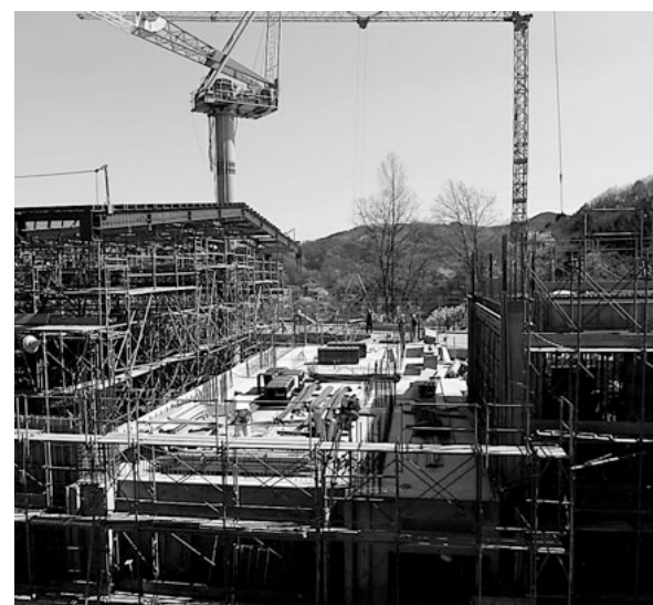
3月31日現在の西中学校

質問 今回の120年ぶりの大雪で、再び工期の延長はあるのか。 答弁 学校教育課長 3月31日現在の西中学校