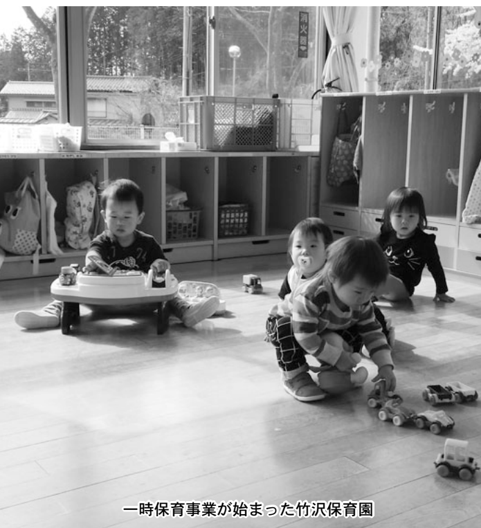
一時保育事業が始まった竹沢保育園

問 一時保育事業を竹沢保育園で開始することだが、職員の配置や保育時間、情報提供は。