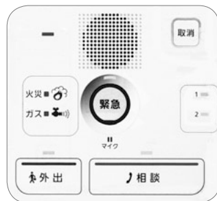
緊急連絡システムのコントローラーとペンダント

しました。仕組みは変わらず、新たな業者を加えました。緊急ボタンを押せば、ガードマンが現場に駆けつけます。トイレの扉にセンサーをつけ24時間安否確認を実施、さらに体調が悪いときの医療相談・健康相談等もできます。