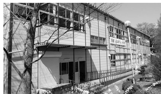
中学生活の拠点となる仮設校舎