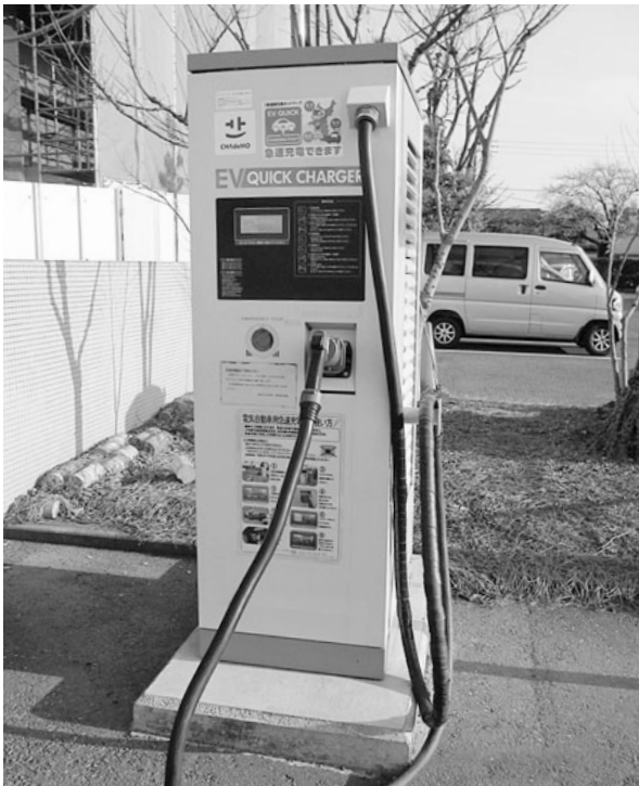
近隣市の充電スタンド

問 過去の議会の中で、一貫して企業誘致や立地支援条例の必要性はないとの見解だった。なぜこのタイミングで、