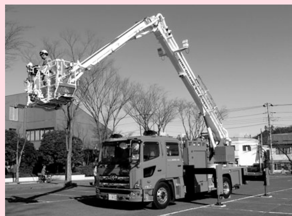
屈折はしご付消防ポンプ自動車 25m伸びます