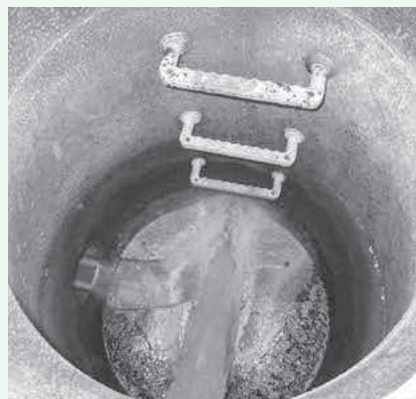
八潮の事故を受けて自主点検を実施

A 上下水道課長 人口減少に伴う経営状況の悪化が予想されます。当町が管理する下水管には耐用年数を超えるものはありませんが、劣化状況に応じた対応を実施していきます。