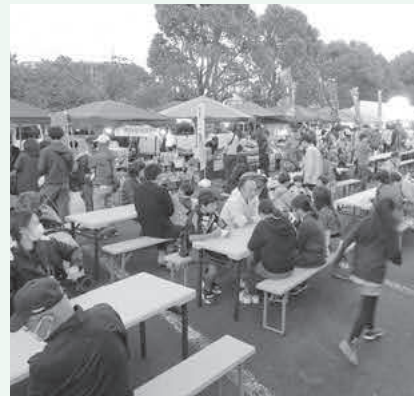
コロナ後復活した東小川の秋まつり

コロナ後のイベント等の再開の難しさが顕在化している。区長等の集まりで、好事例の紹介などはできないか。 A 防災地域支援課長 好事例の紹介をはじめ、SNSの活用についても情報提供していきます。また、地域コミュニティの維持・発展のために「いきいき地域活動補助金」等を交付します。