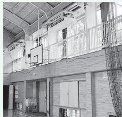
体育館に設置されたエアコン(川越市)

A 防災地域支援課長 能登半島地域の災害における教訓を踏まえ、トイレカーやキッチンカー、