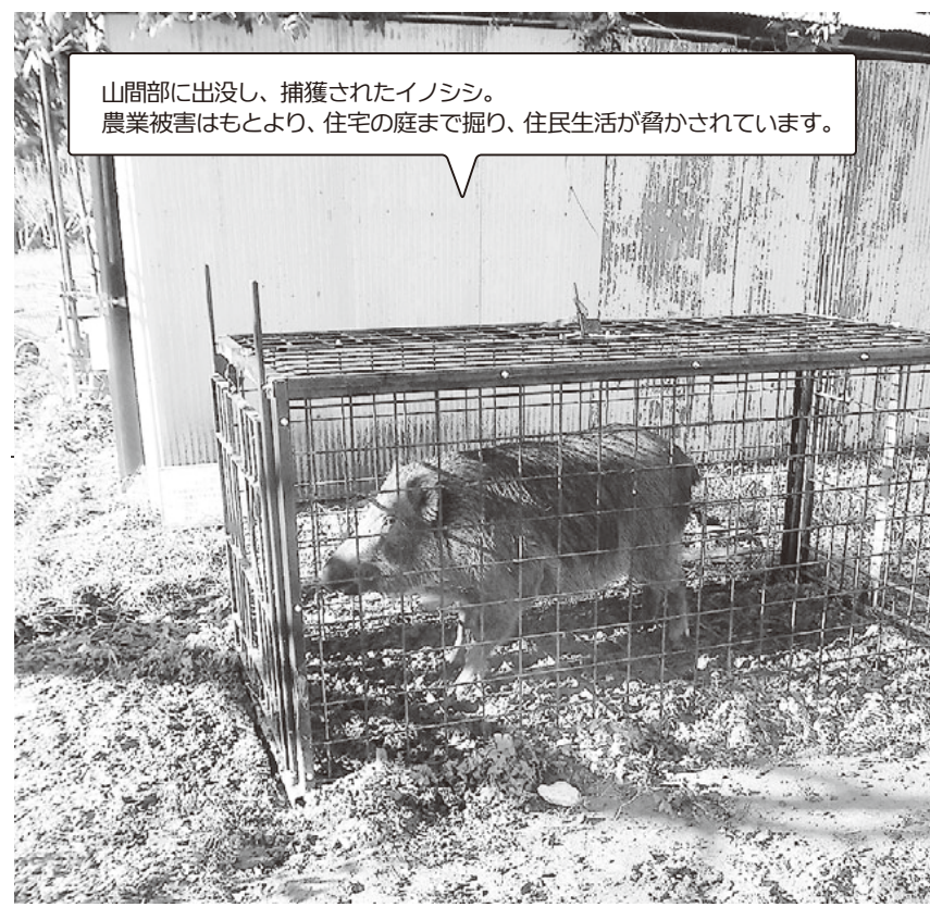
山間部に出没し、捕獲されたイノシシ。農業被害はもとより、住宅の庭まで掘り、住民生活が脅かされています。

A さまざまな啓発活動を行っています。一番効果的なものが電話での受診勧奨です。平成29年度は、対象者809人中217人で26%、平成30年度は、対象者623人中199人で31%の方が受診しました。令和2年度も力を入れていきます。