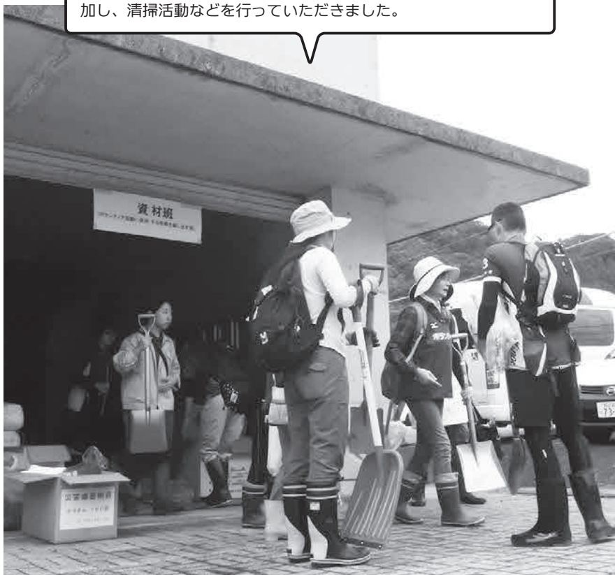
10月15日から30日までの16日間、当町初の災害ボランティアセンターが開設されました。のべ142人のボランティアの方が参加し、清掃活動などを行っていただきました。

A 社会福祉協議会が開設の準備をしてきました。町でボランティア活動をされる方の保険や備品を備えていく考えです。必要とされる方とのマッ