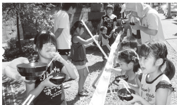
地域への子育て支援を

紙のふるさと小川町の 魅力を積極的に発信し ていきます。さらに町 のホームページを全面 リニューアルし、情報 発信力の強化に努めま す。