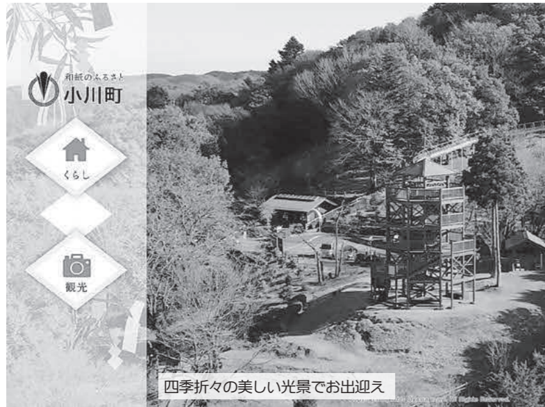
四季折々の美しい光景でお出迎え

Q 令和7年2月、町ホームページをリニューアルしたが、その成果は。 A デザインの刷新やスマートフォン対応に加え、アクセシビリティの向上、検索機能の強化、様々なお問い合わせに回答するチャットボット機能の追加、小川町公式LINEや公式YouTube等との連携を図りました。ホームページを見た方が必要な情報によりアクセスしやすい環境となったものと考えます。トップページには視覚に訴える動画を掲載することで関心を引きや