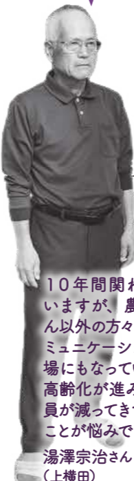
高齢化と 会員減少

Q どのような団体に交付されているのか。 A 水路の保全・災害防止・草刈りなど農地とその周辺の環境に維持・発揮を目的とする地域の共同活動に取り組む15団体に支援を行っている。支援を受ける条件として、5年間の活動計画書・会