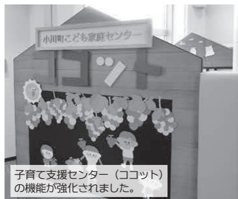
子育て支援センター（ココット）の機能が強化されました。

AQ センターを設置した成果は。 A こども家庭センターでは、「児童虐待や児童虐待が疑われるケースや支援を必要とするご家庭などへの対応」について、関係機関と連携を図りながら、早期かつ適切な対応に努めているところです。