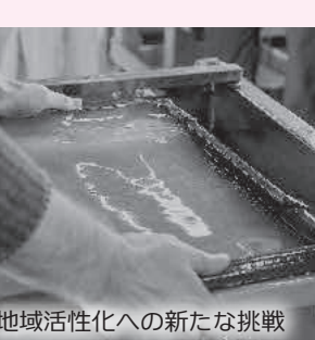
地域活性化への新たな挑戦