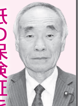
た な か た つ お 田中立男議員 が町に問う！