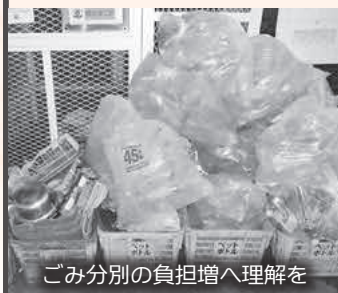
ごみ分別の負担増へ理解を

Q 令和4年4月1日から可燃ごみの処理方法が変わるため、住民の理解と協力が必要である。周知を進めることが重要だが、進捗は。 A 環境農林課長 11月の広報やホームページで周知しています。また、今後は更に一人一人の意識改革と実践が進むよう、一層の啓発を図っていきます。 Q 令和3年2月12日に表明した「ゼロカーボンシティ宣言」後の現状は。