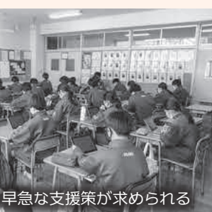
早急な支援策が求められる