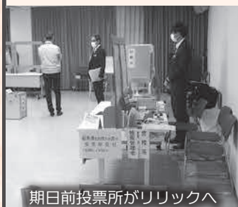
期日前投票所がリリックへ

Q 他の自治体で、期日前投票所の立会人を高校生がやっているとの報道があったが、当町では考えられないか。 A 総務課長 若年層の選挙への関心を促すとともに、投票率の向上を目的とし、一定の啓発効果が期待できます。当町でも、選挙管理委員会に諮り、前向きに検討します。 Q 今回の衆議院議員総選挙の投票率で当町は62・55%、県では3位だった。期日前投票