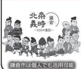
鎌倉市は個人でも活用可能

Q 今年の大河ドラマは「鎌倉殿の13人」。地域にゆかりの人物も登場している。町の受入れ準備は進んでいるか。 A にぎわい創出課長 比企地域独自のロゴ・イラストを作成し提供することも一考であり、協議します。 Q 深谷市の「青天を衝け」はロゴ等を活用した商品の経済効果が8億8000万円とあり、この取組は事業者