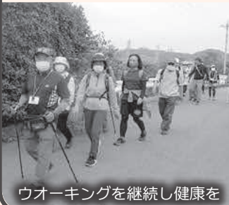
ウォーキングを継続し健康を

Q 健康増進と医療費抑制につながる優れた取組として、「小川町健康マイレージ事業」が県から表彰を受けた。詳細は。 A 健康福祉課長 平成29年度から県の「コバトン健康マイレージ事業」と連携した、独自の健康ポイント事業を展開しています。歩数や体組成の測定・運動や栄養等に関する教室への参加にポイントを付与し、ポイントに応じた特産品を進呈す