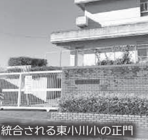
統合される東小川小の正門

Q 11月5日に東小川小学校の全保護者の署名を添えたスクールバス代等の公費負担を求める要望書が町長と教育長に提出された。また、地元住民の反対署名活動が進められているが、各家庭に毎月1000円の負担に変わりはしないか。