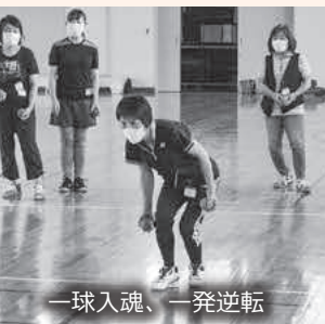
一球入魂、一発逆転