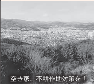
空き家、不耕作地対策を！

Q 空き家や不耕作地対策を求める声があるが。 A 都市政策課長ほか 空き家バンクの累計は45件登録で32件成約です。他市町の例を把握、施策に生かすよう努めます。新規就農は10人で不耕作地防止につながっているが、全農家支援も考えます。 均等割の廃止を Q 国保税滞納による差し押さえ件数は比企郡で小川町が最多で、