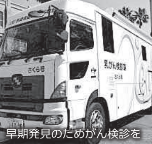
早期発見のためがん検診を

Q 抗がん剤治療による副作用に寄り添う医療用「ウィッグ」の購入費用を助成しては。