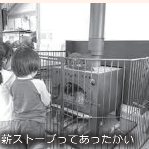
薪ストーブってあったかい