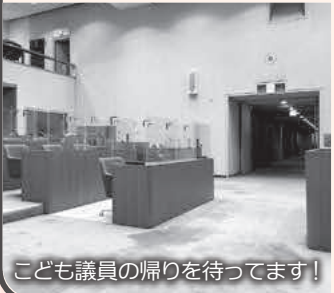
こども議員の帰りを待っています!

Q コロナ禍を追い風にギガスクール構想の取組が進み、各学校のWi-Fi環境も整った。前回と比べ、こども議会の視聴や共有もスムーズに行えると捉