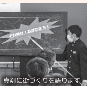
真剣に街づくりを語ります