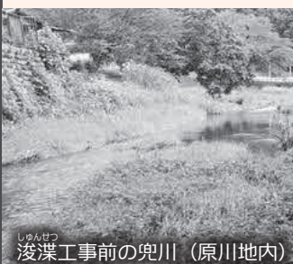
浚渫工事前の兜川（原川地内）

Q 台風19号発生事例から、何を学び、活かしたのか。 A 防災地域支援課長 指定緊急避難場所の見直しと、洪水ハザードマップを新たに作成し、全戸配布しました。 Q 河川の浚渫工事の進捗状況は。 A 建設課長 槻川、兜川、市野川総距離で4700メートルが完了しています。 Q 自主防災組織の結成率は。 A 防災地域支援課長