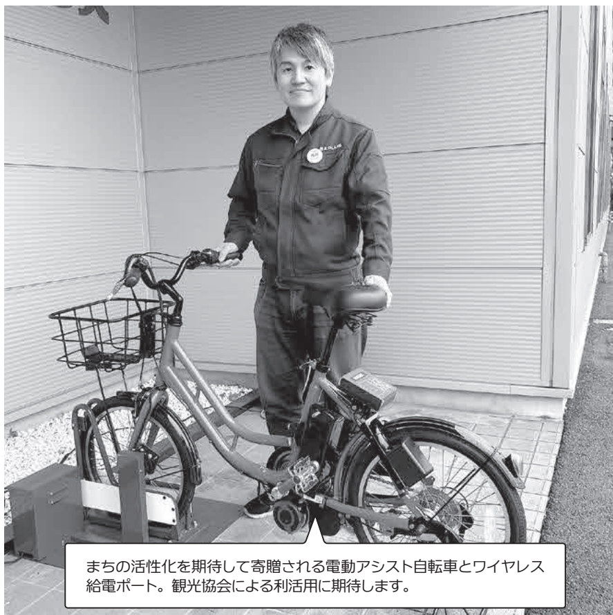
まちの活性化を期待して寄贈される電動アシスト自転車とワイヤレス給電ポート。観光協会による利活用に期待します。

Q レンタサイクル事業 観光協会に補助金として示すに設定し、公募をしました。売却後の用途を法令の制限以上には行っていない。今後、もし配慮を要する必要がある土地があれば考慮し、売り払いを行っていきます。