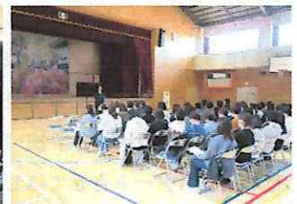
2年生学年保護者会のようす