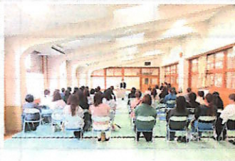
1年生学年保護者会のようす