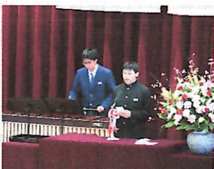
送ることばのようす