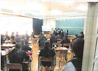
1年生の授業参観のようす

小川中学校がゼロからスタートしこの1年間で、学校での教育活動やPTA活動の土台の基礎づくりができました。しかし、よりよい小川中学校を創っていくためには、まだまだ課題があります。保護者の皆様には、今後も小川中学校へのご理解、ご協力のほど、よろしくお願い申し上げます。