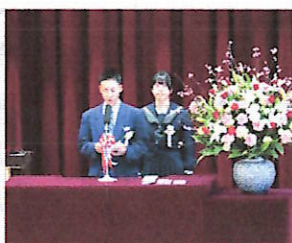
別れのことばのようす