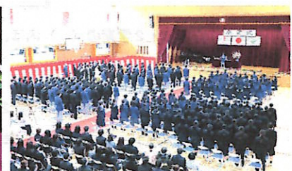
全校合唱のようす