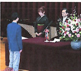
卒業証書授与のようす

卒業式では、卒業生86名の先輩達は立派な態度で式に臨み、素晴らしい歌声を披露して、それぞれの進路先へと巣立っていきました。皆さんのおかげで、第1回小川中学校卒業式が、参列者全員にとって感動的な素晴らしい式となりました。ありがとうございました。