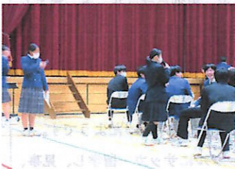
3年生へのインタビュー