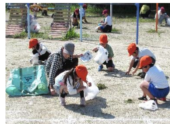
草取りに励む1・2年生