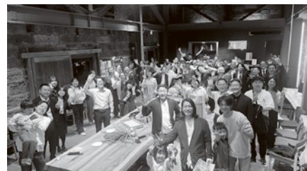
4周年記念パーティーの様子。 多くの会員さんが集まってくださいました。

そして8月16日(土)は石蔵座の映画上映終了後12時から、通常のコワーキングエリアも含めカフェとして営業いたします。涼しい石蔵で、ご友人との楽しい時間やコーヒー片手に読書など一人のんびり過ごす時間等にご利用ください。