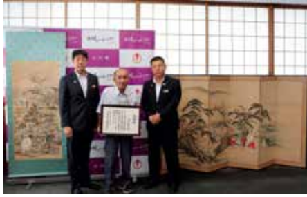
田中竹翁が手掛けた屏風及び掛け軸