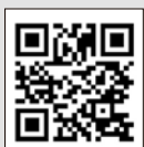
公式 X (Twitter)