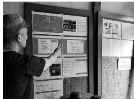
TURUYAオープンまでの軌跡を説明するKさん

小川町にはたくさんの魅力がありますが、建築やDIYをきっかけに町に関心を持ってくださる方が増えるのも素敵ですね。これからの展開が楽しみです。