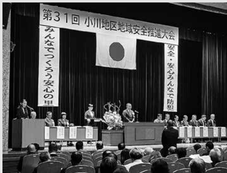
11.5 第31回小川地区地域安全推進大会