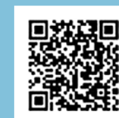
マイナポータル連携