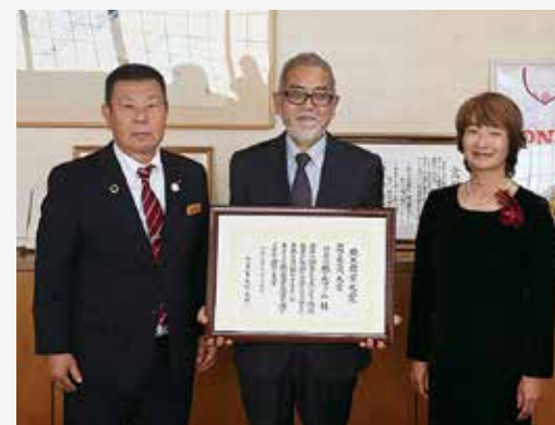
（株）風の丘ファーム 「埼玉農業大賞」 受賞