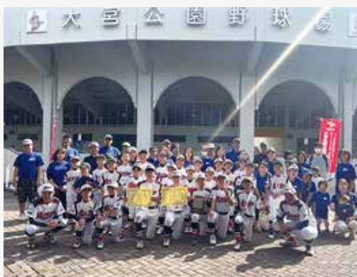
「小川ネクサススポーツ少年団」県大会3位 10.6・13・20・27 少年団の皆さん

これにより、同大会の2012 ~ 2024大会までの11年連続出場表彰という快挙を成し遂げました。