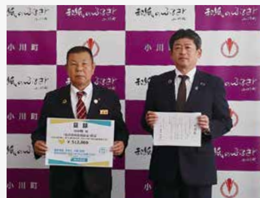
「私の地元応援募金」