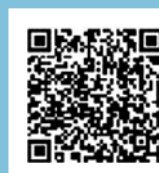
動画で見る確定申告

【書面による申告書等をご提出される方へ】書類提出は東松山税務署へ 1月以降、確定申告書等控えの収受日付印を廃止しました。 申告書等の提出年月日は、ご自身で記録・管理をお願いします。