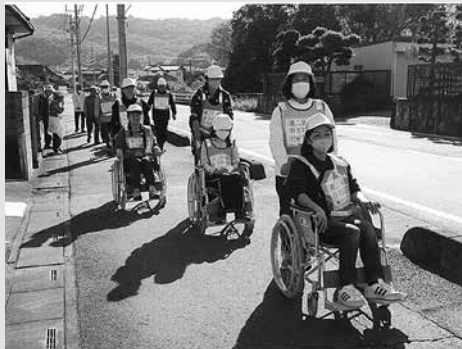
11.17 腰二区みんなで防災訓練

腰二区自主防災会では防災訓練を実施しました。 総務・情報班は情報収集訓練、消火・救出班は消火訓練、避難・誘導班は避難誘導訓練、給食・給水班は炊き出し訓練を行いました。 消防団にも参加していただき、女性消防団員によるAED体験など盛りだくさんの内容となり、なごやかで有意義な訓練となりました。（腰二区長 清水さん寄稿）