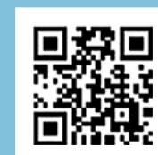
確定申告書等作成コーナー