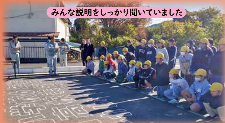
みんな説明をしっかりと聞いていました