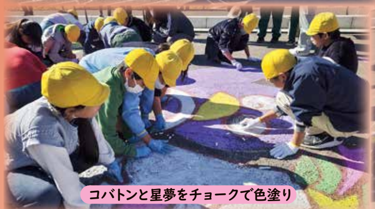
コバトンと星夢をチョークで色塗り