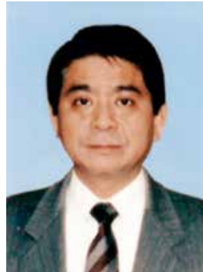
○警察功労 瑞宝双光章