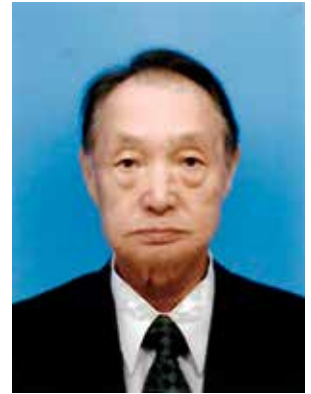
○警察功労 瑞宝単光章