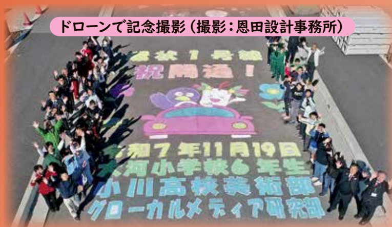
ドローンで記念撮影