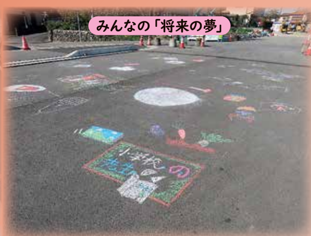
みんなの「将来の夢」