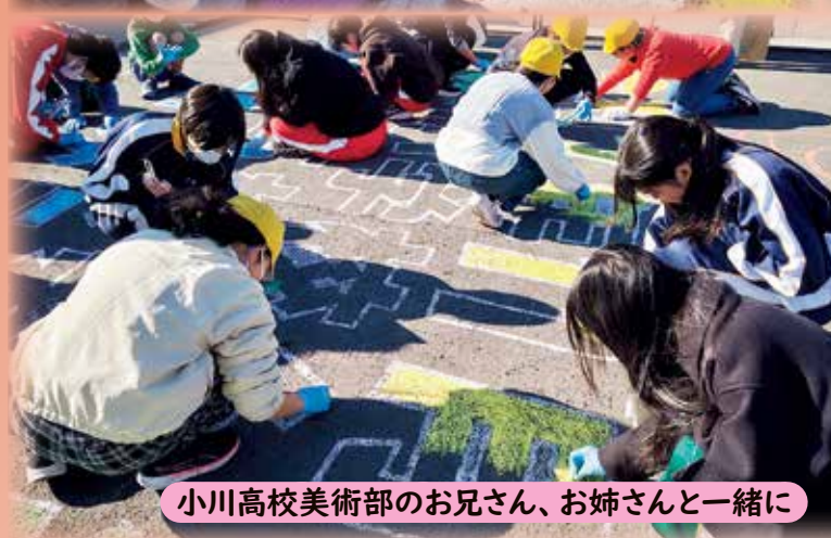
小川高校美術部のお兄さん、お姉さんと一緒に