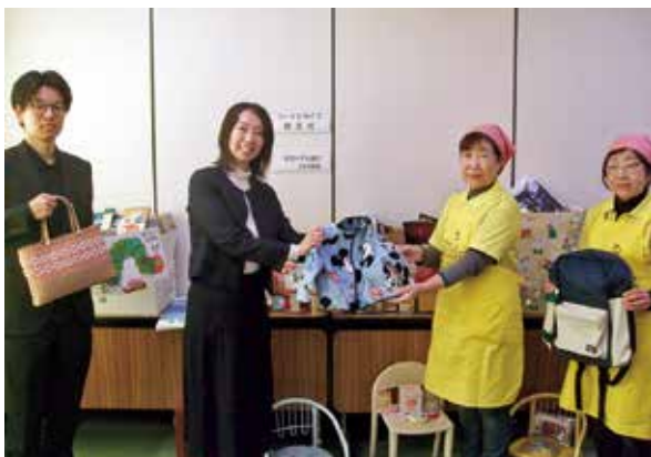
埼玉りそな銀行小川支店から寄贈 （フードドライブ）