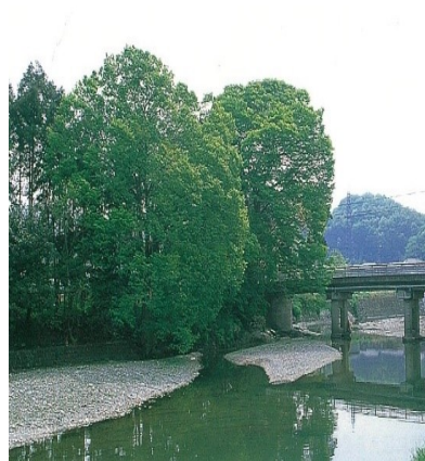
ケヤキの古名は「槻」で、槻川の由来に

申込み 11月20日(木)までに電話・窓口にて。 先着のため、お早めにお申込みください。