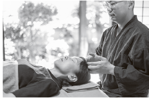
久喜さんの施術のようす

移住サポートセンターは物件オーナーさんからのご相談もお受けしています。片付け等が済んでいなくても遠慮なくご連絡ください。