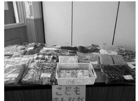
支援者の方々から提供された食品・生活雑貨