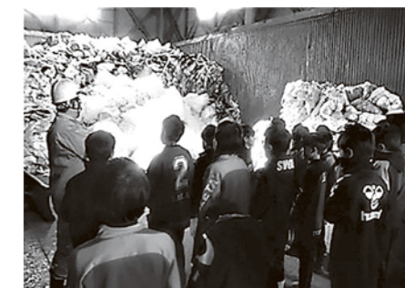
リサイクルプラント見学

サッカー教室では、浦和レッズのハートフルクラブのご協力をいただき、スパイクなどの道具を大切に扱うことやボールコントロール、紅白戦などが行われ、元気良く、楽しくプレーをしました。