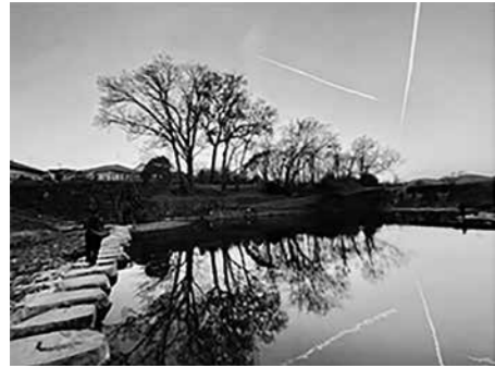
「栃本親水のリフレクション」 @xinjingayumi6