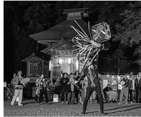
「祭りのフィナーレ」 @hiro2017sony