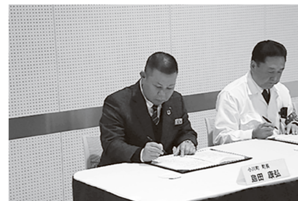
協定書に署名する島田町長(左)

この協定は、災害時における指定避難所等の運営、応急対策及び復旧業務を実施するにあたり、物資等の一時保管場所や車両の貸与、避難場所の提供のために必要な事項を定め、安定した災害復旧を行うことを目的としています。