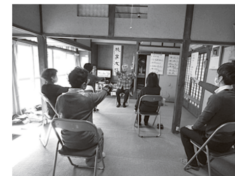
錦町の活動のようす 令和5年10月～

「いきいき百歳体操」以外にも指体操や脳トレ体操、終了後には参加者との交流を楽しむ時間を取り入れるなど工夫しながら楽しく取り組んでいます。