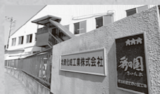
「彩の国工場」の指定を受けた工場