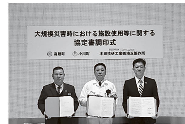
左から島田町長、軸屋所長(本田技研工業)、峯岸町長(寄居町)