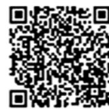
デジタル庁 ウェブサイト