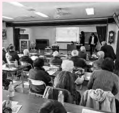
腰中地区のいきいきサロン

Q 当町の高齢化率は、令和4年度40・3%で、県内で鳩山町、東秩父村に次いで第3位である。高齢者やアクティブシニアとして活躍している方々のさらなる健康長寿を延伸できるような支援が重要と考えるが。 A 長生き支援課長 「ウルトラ防犯パトロール隊」をはじめ、地域のボランティア活動やスポーツ活動を進めています。また「いきいき百歳体操」などの介護予防事業への参加等、アクティブシニアの活躍を支援しています。令和5年5月には庁内検討チームを立ち上げ、新たな支援策の検討を行っているところです。