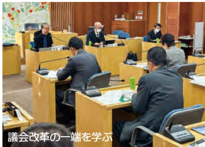
議会改革の一端を学ぶ

「議会改革」といっても、求められる内容は様々だ。議長のもとに各議員から出され整理された内容は15項目。「どの課題から取り組むか」等、まずは小グループでの議論から進め、次のステップを決定していくことになった。