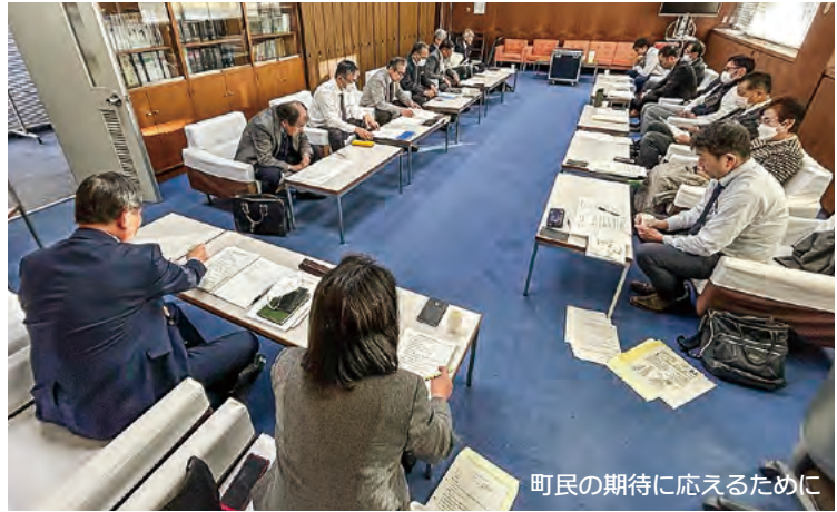
町民の期待に応えるために

「議会改革」といっても、求められる内容は様々だ。議長のもとに各議員から出され整理された内容は15項目。「どの課題から取り組むか」等、まずは小グループでの議論から進め、次のステップを決定していくことになった。