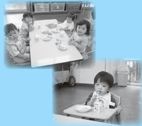
「ベーコンポテト」 おいしく食べられたよ！