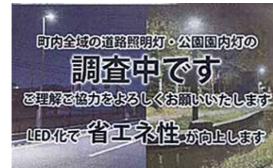
作業員の携行カード(見本)