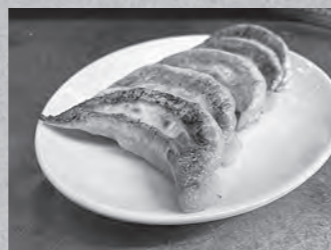
店主こだわりの餃子