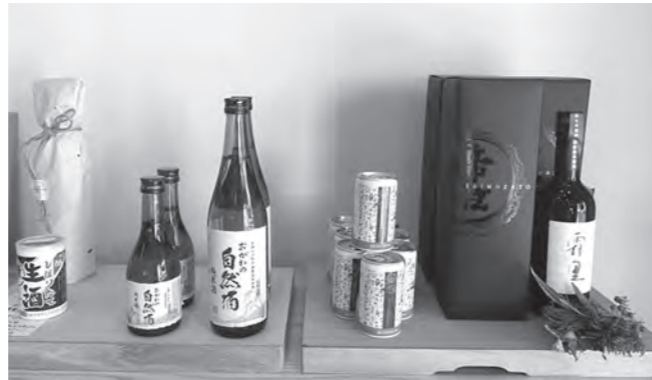
お土産やプレゼント用に和紙でラッピングもいたします

観光案内所 休 無休 問 ☎74-1515 移住サポートセンター 休 月 問 ☎81-5331