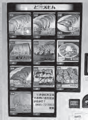
入口に設置されている冷凍販売機