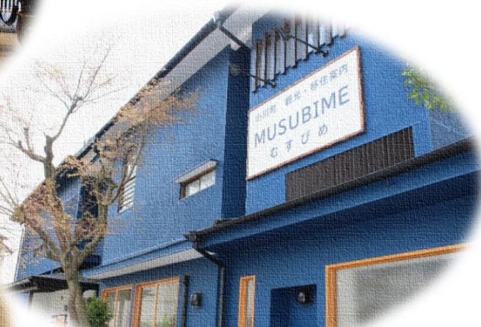
外と内をつなぐ魅力発信拠点「むすびめ」