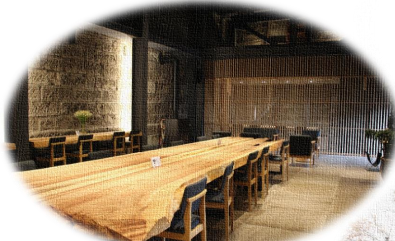
大谷石蔵を改修したサライオフィス「NESTo」