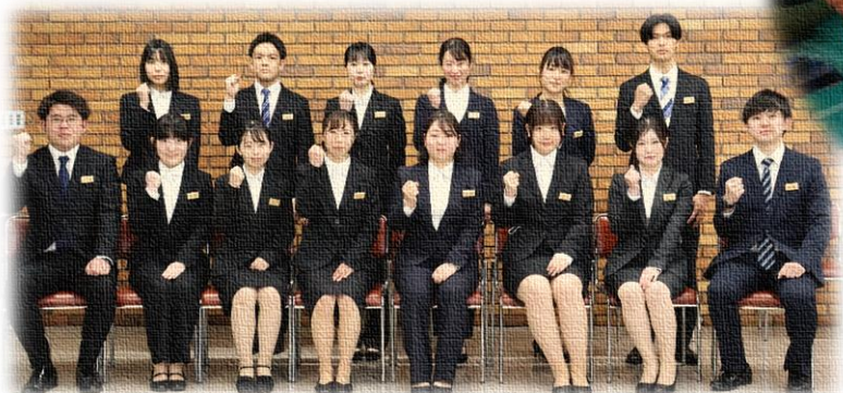
令和4年度新規採用職員(14名)