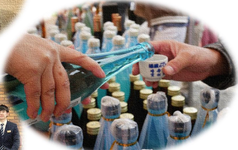
小川町の酒蔵をめぐる「酒蔵めぐり」