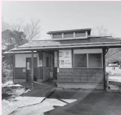
おもてなしはトイレから始まります

A 環境農林課長 各区長や環境美化推進委員に設置のメリットを伝え、導入等を促していきます。