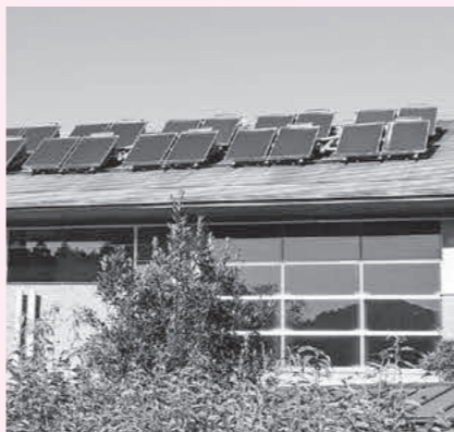
公共施設に設置された太陽光パネル

A 環境農林課長 宮崎県延岡市の「デジタル地域通貨の発行によるニュータウンの再生」や「脱炭素化を組み合わせた災害に強いまちづくり」といった計画は、参考になると捉えています。また、鳥取県米子市や島根県邑南町の提案も参考になるものです。