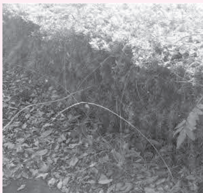
歩道にはみ出そうな草木の様子

A 学校教育課長 5年に1度、関係機関が連携し点検しています。また、日常的に教職員や登下校の見守り隊等による危険箇所の報告・確認を行っています。指導については、発達段階に応じた交通安全教室の実施や、地域安全マップを作成し、喚起しています。