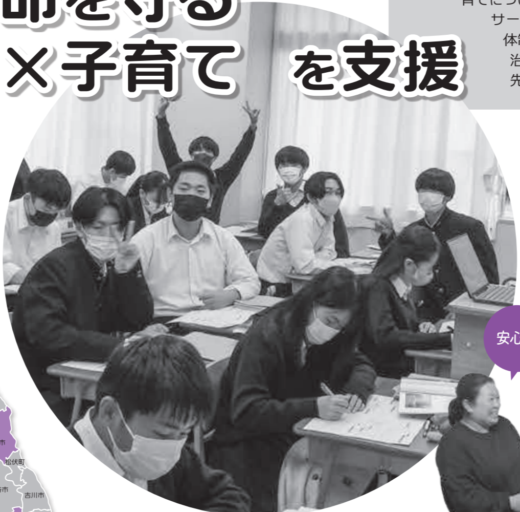
小川高校の皆さん

Point.3 町独自の子育て支援は 平成30年度にココット（子育て総合センター）を設置し、いち早く子育てについてワンストップでサービスが受けられる体制を整えた。他の自治体では見られない先進的な取組である。