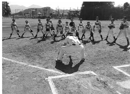
水口コーチによる守備指導

教室では、埼玉西武ライオンズOBのアカデミーコーチが、小学生（スポ少団員）・中学生（野球部員）を対象に、野球技術向上のために野球の基本をはじめ、プロ野球選手時代に培った知識を伝えました。