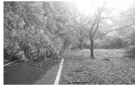
倒木により通行止めとなった道路

山林を放置すると災害を誘発する恐れがありますので、地権者として近隣の住民の方が快適な生活環境が保持できるよう、山林の定期的な管理をお願いします。