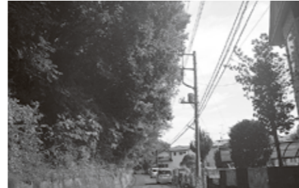
木がかぶさった電線