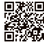
ハザードマップは町HPからも確認できます。