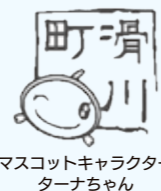
マスコットキャラクター ターナちゃん