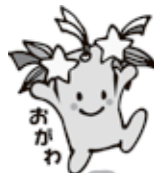
小川町マスコットキャラクター またね 星夢ちゃん