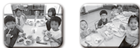
『豚肉と野菜の千切り炒め』ピーマンも全部食べられたよ！