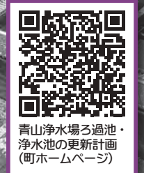
青山浄水場ろ過池・浄水池の更新計画(町ホームページ)