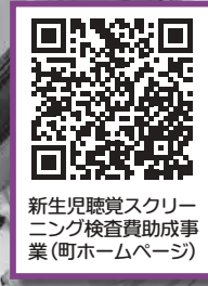
新生児聴覚スクリーニング検査費助成事業(町ホームページ)

A 誕生後早期に聴覚検査をし、難聴が疑われる場合には、児童の言語の発達等を促すために適切な支援をします。埼玉県が医療機関と一括で契約し、助成を市町村が行います。検査はO A