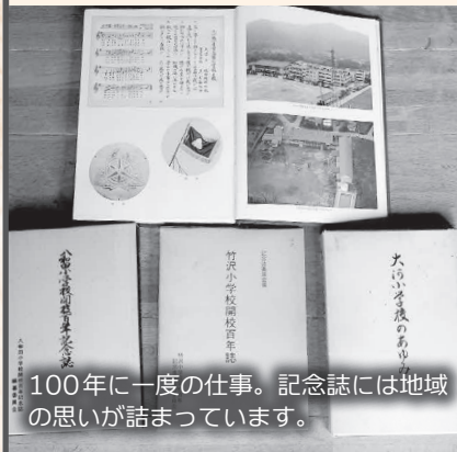
100年に一度の仕事。記念誌には地域の思いが詰まっています。