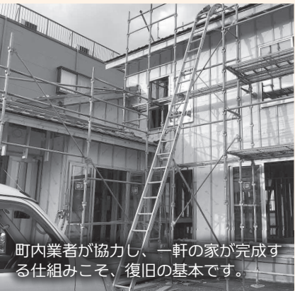
町内業者が協力し、一軒の家が完成する仕組みこそ、復旧の基本です。