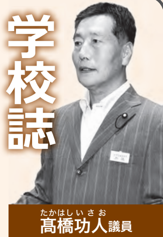
たかはしいさお 高橋功人議員

一般質問とは、議員が町の現在の施策、将来の考え方や説明を町長などに求め、町民のための適切な町政運営を行っているかチェックするものです。