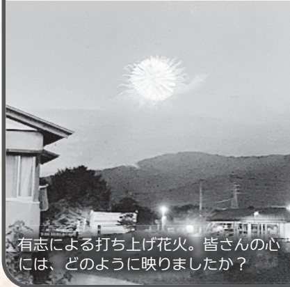
有志による打ち上げ花火。皆さんの心には、どのように映りましたか？

A 町長 中止にもかかわらず、町内に飾られた竹飾りや花火に七夕まつりに馳せる町民の強い想いを感じました。盛大に開催し、後世に引き継ぐよう取り組んでいきます。