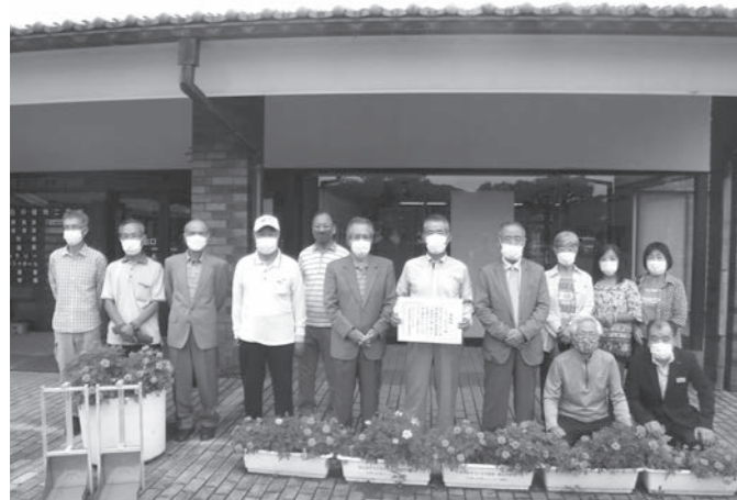
下小川一区青壮年会