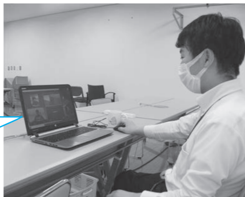
オンラインお茶会の様子