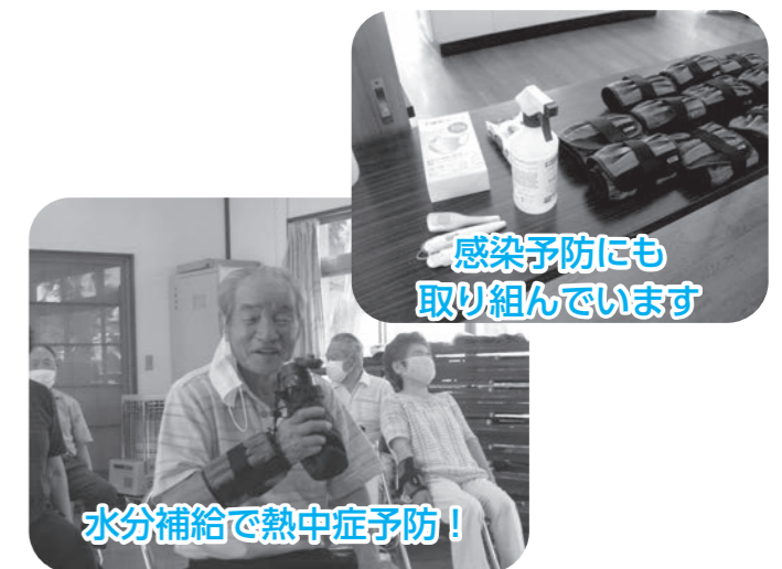
感染予防にも 取り組んでいます