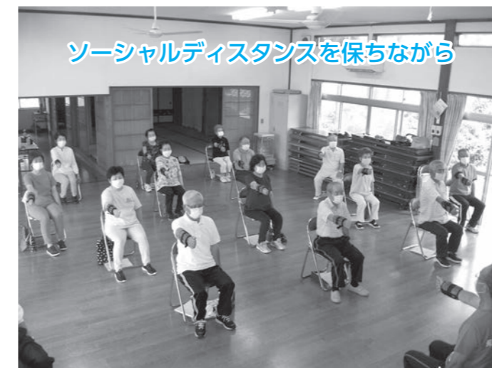
ソーシャルディスタンスを保ちながら