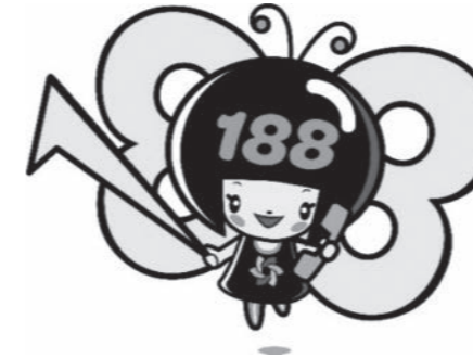
消費者庁 消費者ホットライン188 イメージキャラクター「イヤヤン」

「身に覚えのない商品が送られてきた」、「助成金があるので個人情報や口座情報を教えてほしい」などの新型コロナウイルスの感染拡大に関連したトラブルで困っていませんか？ そんなときは一人で悩まずに、全国どこからでも3桁の電話番号でつながる消費者ホットライン「188(いやや!)」にご相談ください。専門の相談員がトラブル解決を支援します。