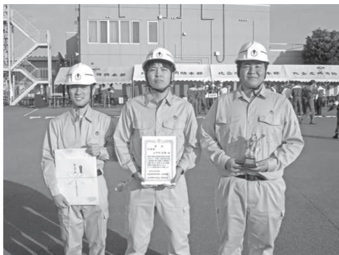
小川町役場チームのみなさん