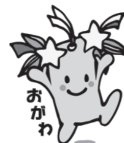
小川町マスコットキャラクター 星夢ちゃん