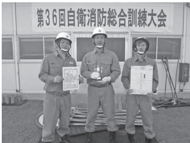
本田技研工業(株)埼玉製作所 小川工場A Eチームのみなさん

10月1日、比企広域消防本部と比企地区危険物防火安全協会が主催する自衛消防総合訓練大会が、比企広域消防本部総合訓練場で行われました。比企広域消防署管内の26事業所・31チームが参加し、火災発見から避難誘導、消火器による初期消火、119番通報、屋内消火栓操作、消防への引継ぎ等の技術を競いました。町内の事業所からは、6チームが参加し、男子の部で本田技研工業(株)埼玉製作所小川工場A Eチームと小川町役場チームが準優勝となりました。