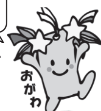
埼玉県けんこう大使 星夢ちゃん

年に1度、ご自身の体調管理のために特定健診を受診してみませんか。「何か見つかりそうで怖いなあ。」「自分は健康だから大丈夫！」と思っている方も、急に病気になって長期に渡って今の生活ができなくなってしまうより、自己負担金1,000円（小川町国保加入者）で特定健診、眼底健診を受診して、大切なあなたの健康状態を確認してみませんか。