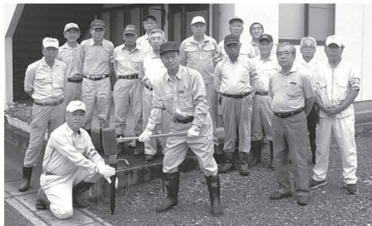
杭入れ式（町長・行政区長・推進委員の皆さん）

なお、10月中旬から、昨年度現地調査を実施した古寺地区の地籍図・地籍簿案の閲覧を予定しています。土地所有者の皆さんは、必ず閲覧するようお願いします。