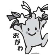
小川町マスコットキャラクター 星夢ちゃん