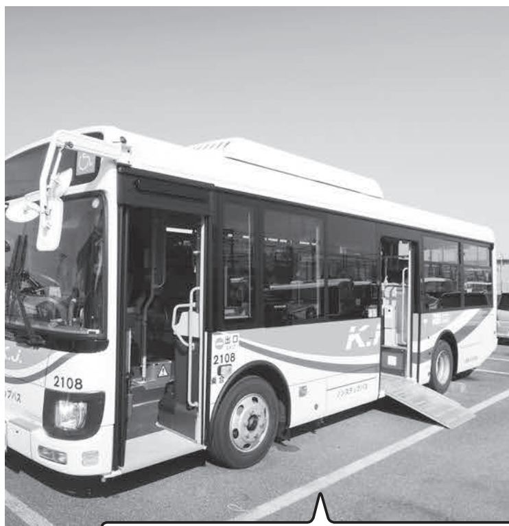
3台の導入を支援する予定です。

A 第2期総合戦略策定のため、本年成人を迎えた方や町内の高校生、町外の小川高校生から自由な意見をじっくり聞きたいと