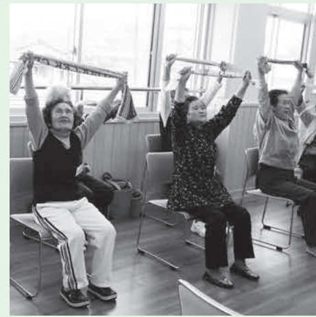
親しい人と会っての会話が元気の源になる。(N/Aはつらつクラブ)

Q 要介護状態になっても、可能な限り「いきいきサロン」や「はつらつクラブ」など地域の活動に参加し、交流を大切にしたい。長生き支援課長 社会福祉協議会の事業である「いきいきサロン」は、実施している地域が参加の条件を決めています。おおむね65歳以上の方という以外、地域の実情に合わせてなるべく参加の範囲を狭めないようお願いしています。「はつらつクラブ」についても、制度を柔軟にすることで、参加しやすくなるよう検討しています。