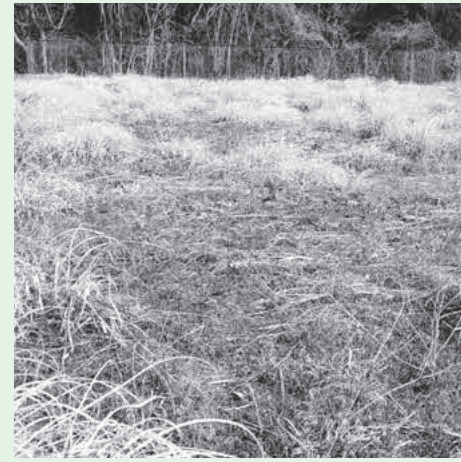
みどりが丘1丁目の町が管理している空き地。

A 政策推進課長 みどりが丘自治会及び住民からの相談や要望があれば、具体的に考えていきます。また、自治会や地域住民の協力があれば、芝生化の実証実験は可能なものと考えています。