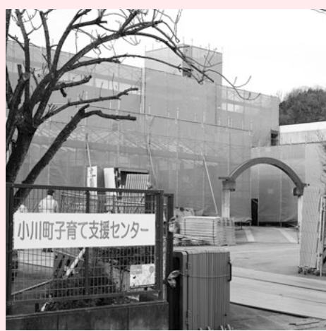
定住移住・雇用・子育ての安心できる環境整備を。

A にぎわい創出課長 現在町内外の企業訪問を行ない、130件程度の相談件数となつています。その中で、女性の働く場・目線が企業訪問は行なつていない現状ですが、その観点を加え進めたいと考えます。また、進出希望の企業に対し、産業誘導地を見つけていくのが課題です。