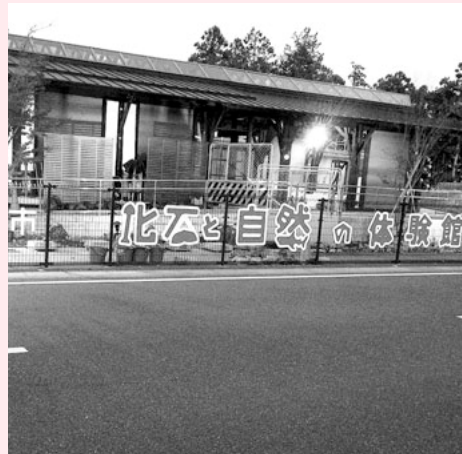
東松山市では、すでに財産を活かしていた。でもまだ遅くないぞ。

A にぎわい創出課長 現在町内外の企業訪問を行ない、130件程度の相談件数となつています。その中で、女性の働く場・目線が企業訪問は行なつていない現状ですが、その観点を加え進めたいと考えます。また、進出希望の企業に対し、産業誘導地を見つけていくのが課題です。