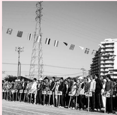
地区民体育祭に参加できない行政区も。

A 学校教育課長ほか まず、現場の確認と研究をしてみます。子供たちが体験を通して学べるように考えていきます。