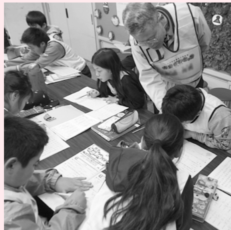
遊ぶ前の勉強も、みんなでやれば楽しいよね。