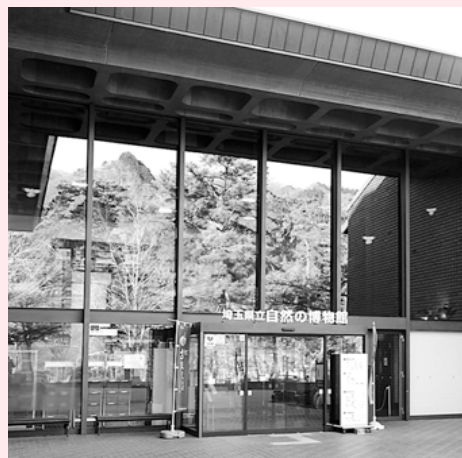
長瀬町「自然の博物館」。プラタモリ効果で、昨夏には過去最多の入館者を数えた。

A にぎわい創出課長ほか 当町は、研究者の間で「地質の博物館」と称され、番組のテーマや構成の素材につながる点が多く存在すると認識しています。国指定史跡となった「下里・青山板碑製作遺跡」は、緑泥石片岩という特徴的な岩石を利用した場所で、歴史的に見ても魅力的なスポットです。番組ホームページを通じて情報提供していきたいと考えています。