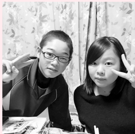
姉は4月に高校入学予定。弟が高校入学までには医療費支給年齢の拡大を。