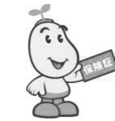
国保マスコット 健康まもるくん

※1 この場合は、75歳の誕生日までに後期高齢者医療制度から新しい保険証が簡易書留郵便で送付されます。