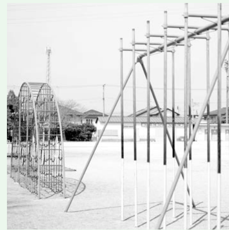
子供たちの冒険心のために、安全・安心が求められる遊具。

A 都市政策課長 点検について教育委員会側から要望があれば、対応を考えていきたいと思っています。