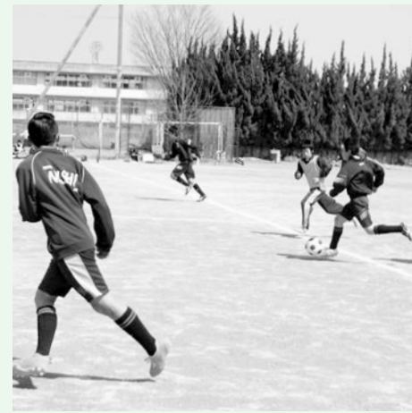
ナイスプレー！ 週末、合同練習に汗する東中・西中のサッカー部員。