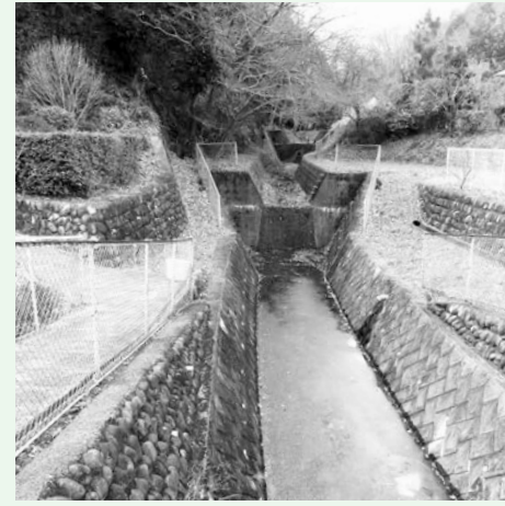
昔は子供たちが魚取りに興じたが、今は死滅した笠原川の3面張りの風景。

Mini Column オガワマチのこと ギカイのこと 一緒に見よう、考えよう 「小川町のおすすめ スポット」