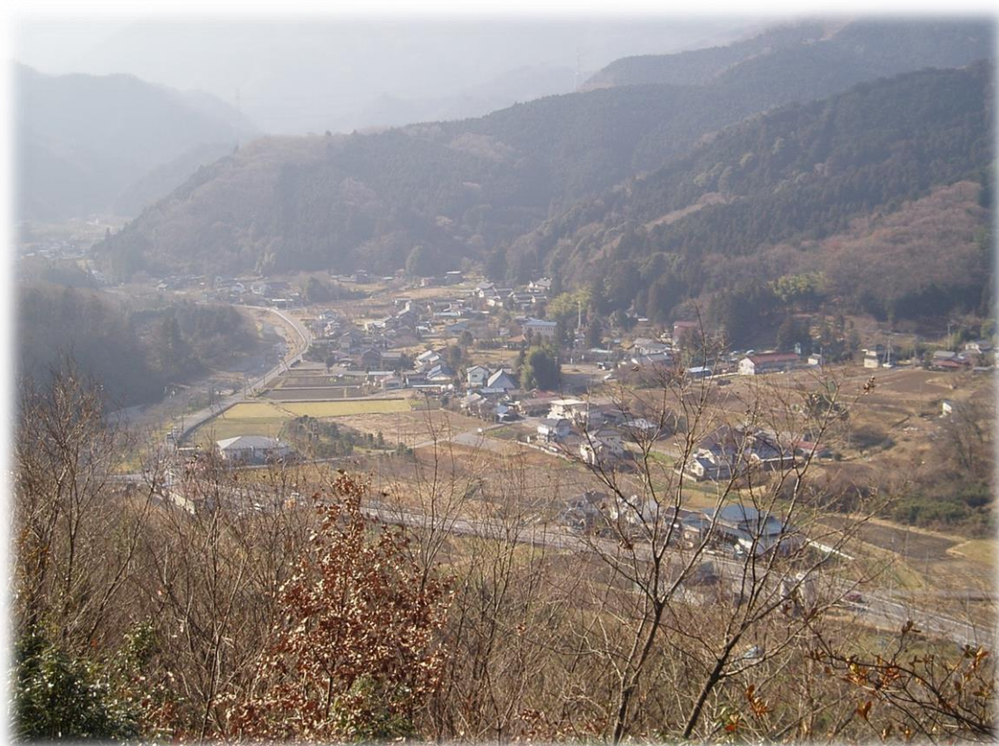
腰越城跡からの風景